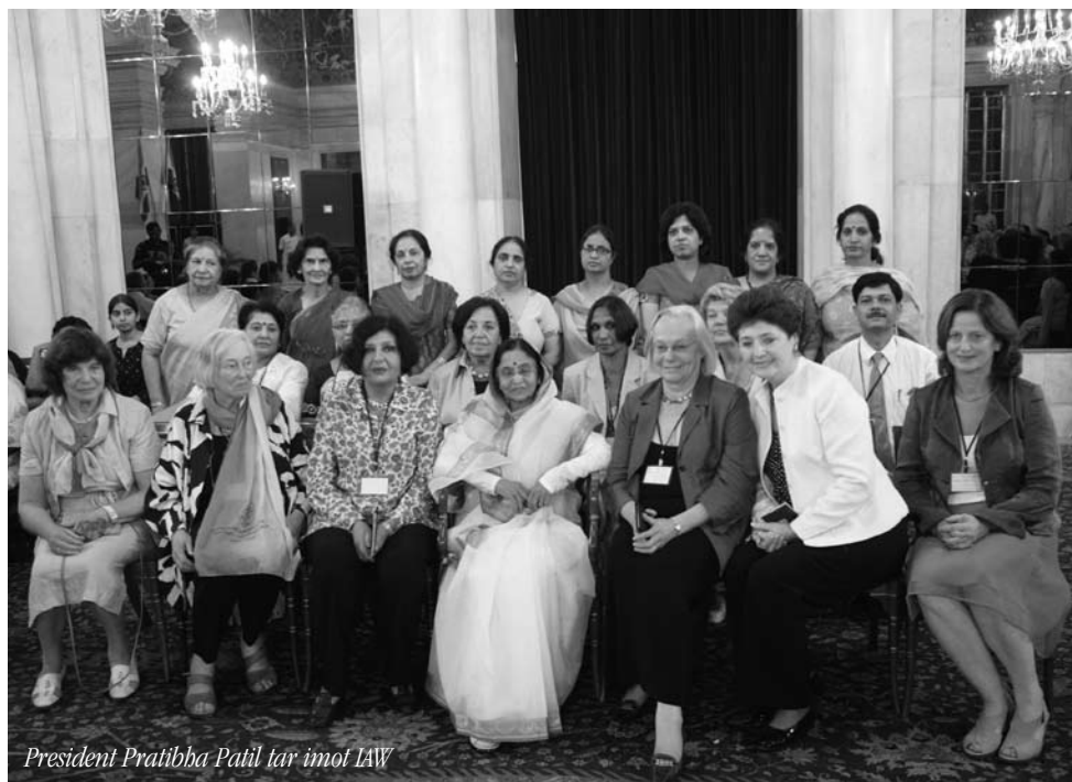
President Pratibha Patil tar imot IAW

India er et lavinntektsland med 1,3 milliarder mennesker. Den økonomiske veksten har vært sterk det siste tiåret, men det er store ulikheter ut fra klasse, kaste, kjønn og geografi. En tredel av befolkningen lever i ytterste fattigdom og kvinner utsettes for mange former for diskriminering. Det ble ikke mye tid til sightseeing, men jeg fikk glimt av kontrastene med rystende slum i Delhi på den ene sida og det storartete monumentet Taj Mahal på den andre. Vertskap for kongressen var AIWC, All India Women's Conference, som ble stiftet i 1927 for å gi kvinner utdanning. Nå arbeider AIWC med spørsmål som Purdah (at kvinner skjules fra offentlig iaktakelse), barneekteskap, trafficking og kvinners eiendomsrett.