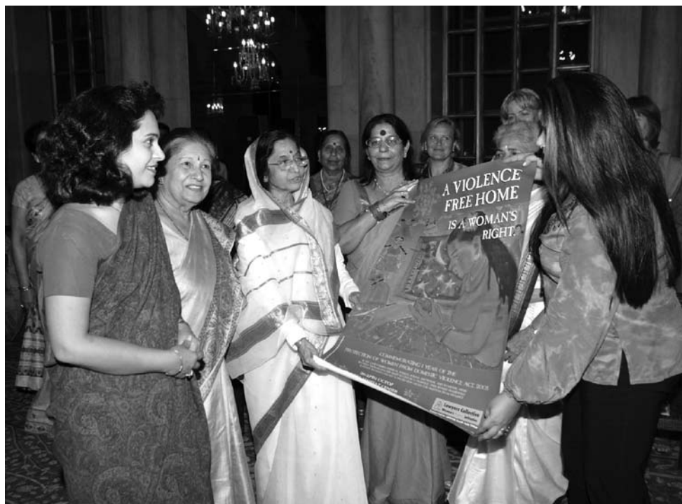
Over: President Pratibha Patil får plakaten